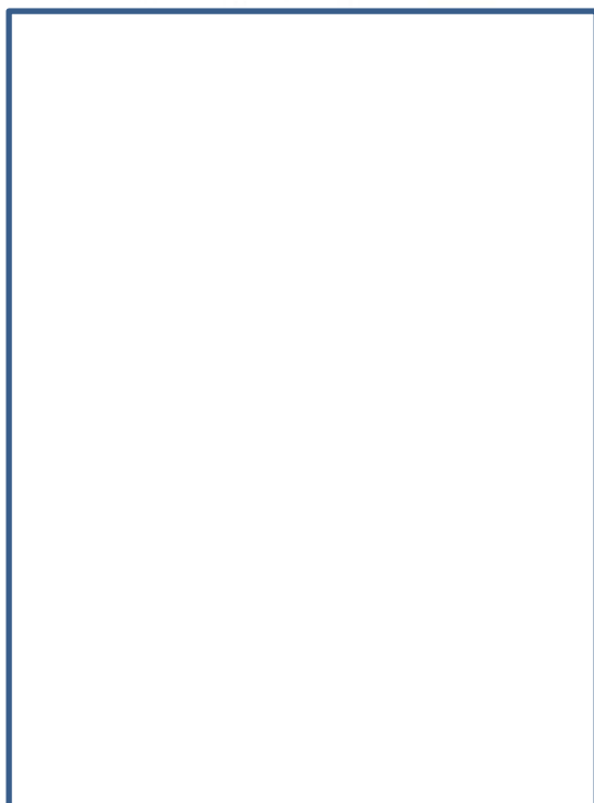
Σχέδιο 110.2 – Τεχνικά ...

Επίσης, σύμφωνα με το Τεύχος 3. Τεχνική Περιγραφή – Ειδικές Τεχνικές Προδιαγραφές παρ.Α.4.3 – Λοιπές απαιτήσεις (σελ. 5) αναφέρεται ότι : «Οι εγκεκριμένοι Περιβαλλοντικοί Όροι (... με αρ. πρωτ. οικ.... και ΑΔΑ ... και Τροποποίηση ... με αρ. πρωτ. ... με ΑΔΑ ... ). Σημειώνεται ότι, τυχόν αποκλίσεις των περιβαλλοντικών όρων που αφορούν τα επιμέρους χαρακτηριστικά των ... της εγκατάστασης και του η/μ ... αλλά καλύπτονται από τις τεχνικές προδιαγραφές του ..., όπως αυτές παρουσιάζονται στα τεύχη δημοπράτησης και θα προκύψουν από τη ... προσφοράς ή την ... εφαρμογής είναι αποδεκτές, εφόσον τεκμηριώνονται επαρκώς και δεν αλλοιώνουν τα βασικά χαρακτηριστικά του ... και δεν επέρχονται σημαντικές αρνητικές διαφοροποιήσεις ως προς τις επιπτώσεις στο ... Στην περίπτωση αυτή ο Ανάδοχος του ... θα υποβάλλει φάκελο συμμόρφωσης της ... όπως προβλέπεται στα άρθρα 7 και 11 του Ν.4014/11.»